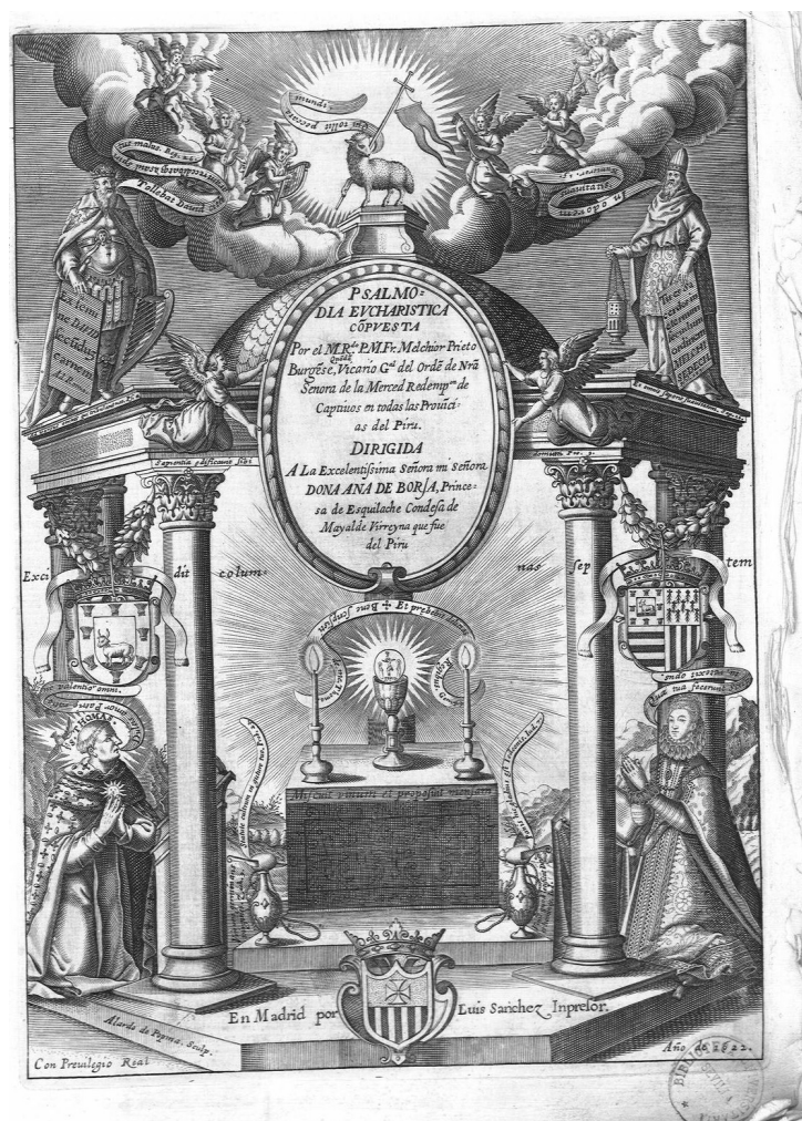
Figura 4. Alegoria eucarística. Extret de Melchior Prieto, Psalmodia Eucharistica , Madrid, Luís Sánchez, 1622.

aquests paràmetres se li aproximava l'antic conjunt de Santa Eulàlia, del qual actualment desconeixem la ubicació i estat de conservació. Aquest estava conformat per personatges en mig relleu però d'una qualitat més discreta. 70 Pel que fa a les pintures, generalment són figures retallades i la qualitat varia segons el temple. La tipologia comuna, la tècnica i els acabats dificulten moltes vegades diferenciar la cronologia. Hi ha models del s. XVIII, com el de les Tereses (Convent de Santa