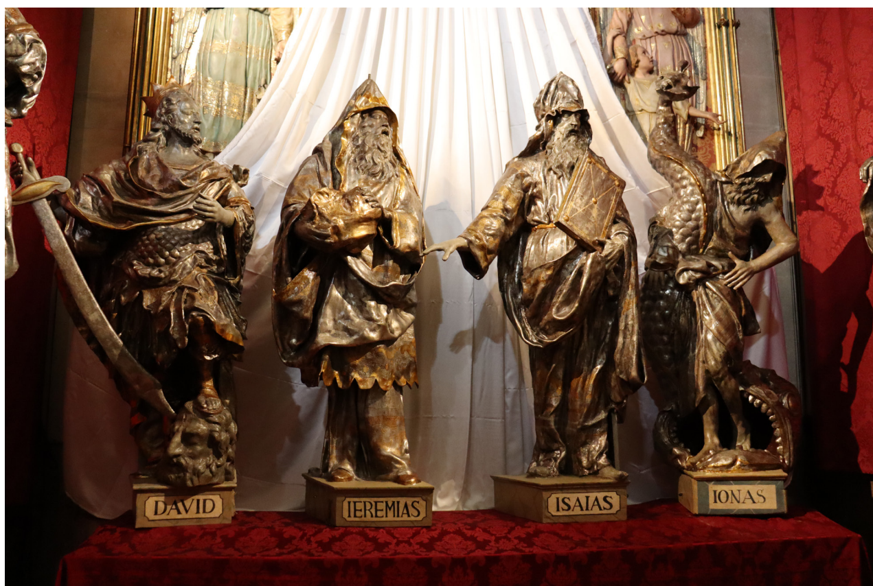
Figura 3. Part del conjunt de profetes i altres personatges de l'antic convent de Sant Domingo. Fotografia dels autors.

La presència d'aquesta tipologia no és exclusiva de Mallorca, perquè sabem que per exemple a Sanremo (Itàlia) també hi hagué manifestacions similars, que coincideixen en temàtica i tipologia. 67 Molts de monuments d'arreu de la Península i altres bandes varen incloure de manera similar figures bíbliques o al·legòriques. El que destaca a Mallorca és la sovint repetició dels mateixos personatges, amb unes representacions similars i una solució formal quasi idèntica. Molt sovint trobem al rei David, els profetes Isaïes, Jeremies, Jonàs, entre d'altres. Dels conjunts conservats prevalen els pictòrics, encara que també hi ha casos escultòrics. D'aquest segon grup cal destacar en primer lloc les escultures de l'antiga Casa Santa de Sant