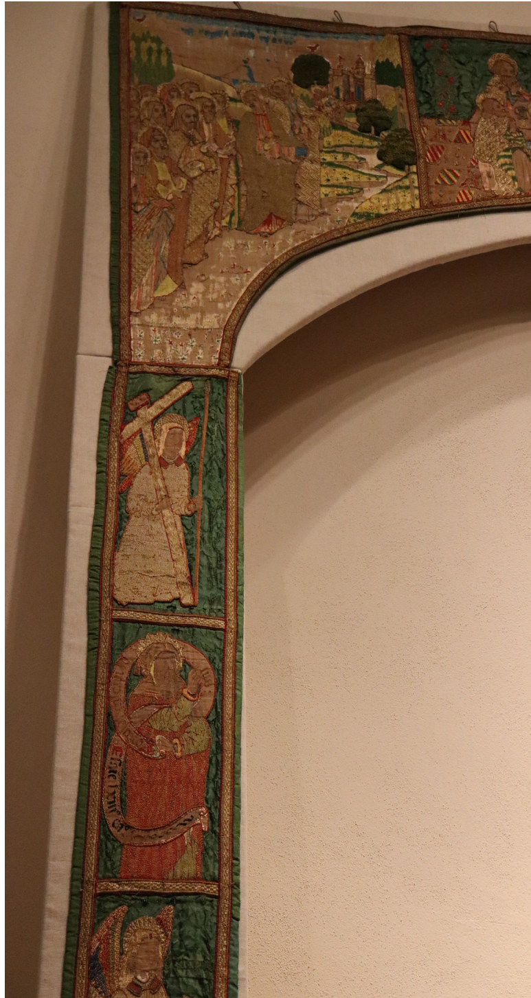
Figura 1. Detall de la portalada brodada conservada al convent de Sant Jeroni.

Aquest cas de les jerònimes, si l'acceptem com un referent general, esdevé un antecedent directe del qual trobarem durant la modernitat. No és el nostre objectiu explicar profundament el progra-